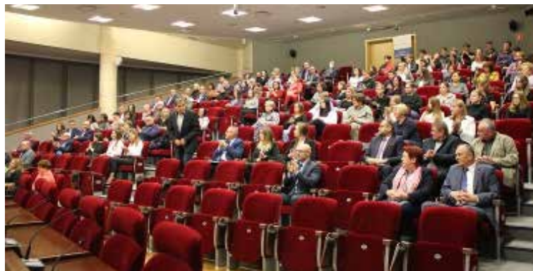
Konferencja zorganizowana została z udziałem przedstawicieli organów współ-

Celem konferencji było zaznajomienie uczestników z praktycznymi i prawnymi aspektami zagadnienia handlu ludźmi oraz zwalczania i zapobiegania temu zjawisku w kontekście pracy sezonowej oraz legalności zatrudnienia. Wydarzenie to było również okazją do podsumowania letniej akcji kontrolno-prewencyjnej Okręgowego Inspektoratu Pracy w Rzeszowie: „Sezon na Bieszczady 2022”.